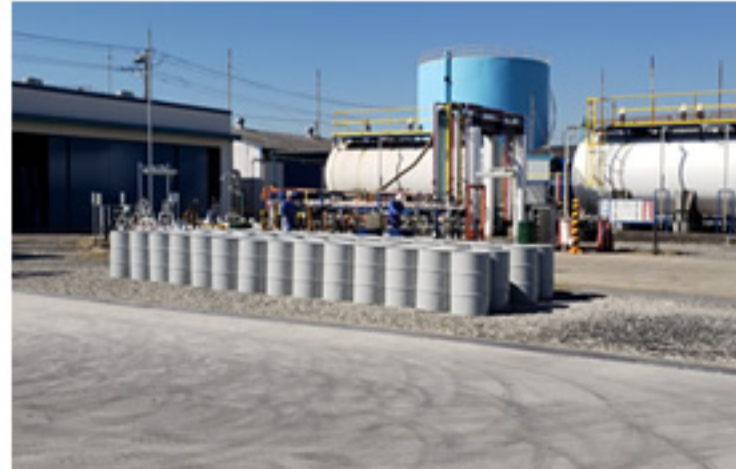
マルチワークステーション