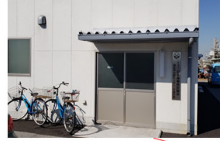
日本海事検定協会 分析室