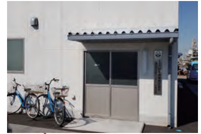
日本海事検定協会 分析室